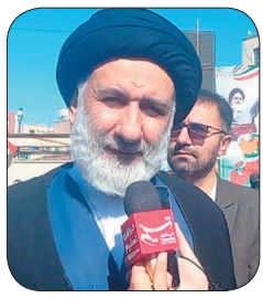
امام جمعه شیروان ملت ایران پشتیبانی خود را از انقلاب اسلامی به نمایش گذاشتند