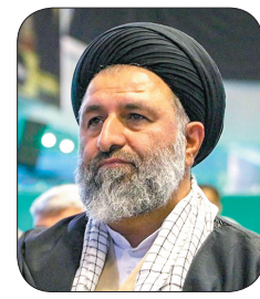
رئیس سازمان عقیدتی سیاسی نیروی انتظامی ایران: مردم با اتحاد در جنگ اقتصادی پیروز می‌شوند