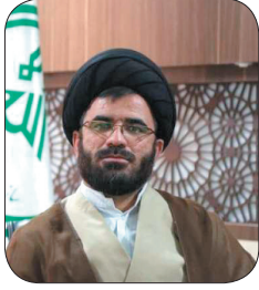
مدیرکل تبلیغات اسلامی چهارمحال و بختیاری: جهاد تبیین، راهکار رفع تهدید، نرم‌افزاری دشمن