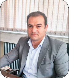
سرپرست شرکت آب منطقه‌ای چهارمحال و بختیاری: اجرای طرح «دانا» و فرهنگسازی از مدرسه تا خانه