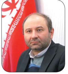
شهریار مرکز چهارمحال و بختیاری ۲۰ هزار و ۸۵۳ میلیارد ریال بودجه پیشنهادی شهرداری شیر کمره مصوب شد