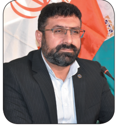
مدیرکل سازمان تامین اجتماعی چهارمحال و بختیاری جشنواره استانی انتخاب کارفرمایان برتر چهارمحال و بختیاری برگزار شد