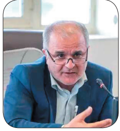
معاون مهندسی امور عمرانی استانبول، نگرانسی در خصوص راهسازی آب سسد زاینده‌رود وجود دارد