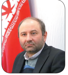
شهردار شهرکرد، هوشمندسازی فرایندهای خدمات شهری در دستور کار شهرداری شهرکرد قرار گرفت