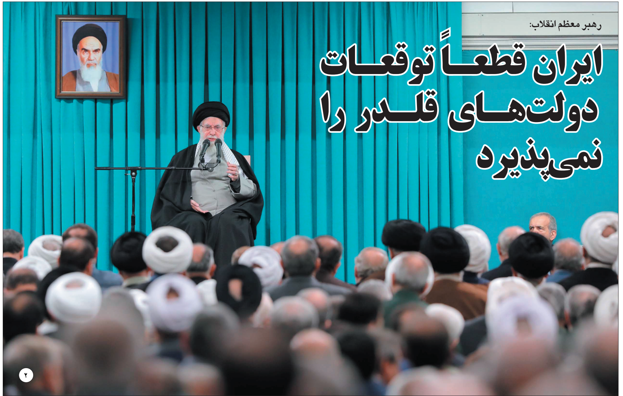
رهبر معظم انقلاب:

به دلایل مختلف که خیلی از آن ها به غفلت نهادهای متولی حاکمیتی برمی گردد نه توانستیم فرهنگ غنی، اصیل و منحصر به فرد ملی مان را حفظ و ترویج دهیم و نه توانستیم ارزش های زینی را آنگونه که باید به جامعه تزریق کنیم و معلق شده ایم در فضایی که هنوز نمی دانیم متعلق به کجاست. با این شیوه و فرآیندی که در پیش گرفته ایم، شوربخانه هیچ روزه نمیدانیم که تحول مثبت در ساختار زندگی، اجتماعی و فرهنگی مان مشاهده نمی شود و کماکان شاهد فاصله هزار فرسنگی بین نسل اصیل ایرانی اسلامی با نسل جدیدی هستیم که به دلیل نداشتن و ارائه یک محتوا و بسته فرهنگی مناسب، خودشان بر اساس سلیقه شخصی به دنبال کشف سبک هایی از زندگی هستند که هیچ سنخیتی با تاریخ و هویت ما ندارند اما چه باید کرد که هیچ برنامه ای از سوی هیچ رسانه، جامعه شناس، وزارت و نهادهای برای این چالش مهم در کشور مطرح نیست و تنها باید اکتفا کنیم به شنیدن و دیدن رویدادها، اخبار و چالش های خطرناک و ناخوشایندی که هزینه تغییر سبک ناخواسته زندگی نزد نسل های امروز کشور عزیزمان است.