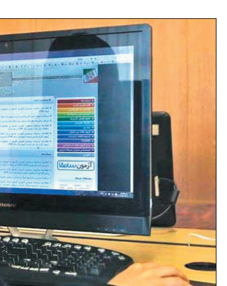
برای کنکور سراسری سال ۱۴۰۴ دو فرصت زمانی ثبت نام در نظر گرفته شده است که بازه زمانی اول ثبت نام از ۲۲

اسفندماه ۱۴۰۳ آغاز می شود. نوبت دوم آزمون سراسری سال ۱۴۰۴ برای پذیرش در رشته های با آزمون در دوره های روزانه، نوبت دوم (شبانه)، نیمه حضوری، مجازی، پردیس خودگردان دانشگاه ها و مؤسسات آموزش عالی، دانشگاه پیام نور و مؤسسات آموزش عالی غیرانتفاعی و غیردولتی و همچنین رشته های تحصیلی با آزمون دانشگاه آزاد اسلامی در تیرماه ۱۴۰۴ برگزار می شود. ثبت نام در این آزمون در دو بازه