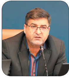
استاندار چهارمحال و بختیاری، با سنگاناندازی جلوی پای سرمایه‌گذاران برخورد می‌شود