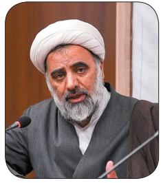
نماینده مردم چهارمحال و بختیاری در مجلس خبرگان رهبری، قوای نظامی و انتظامی در عرصه‌ای شکست‌ناپذیر و بدون بن‌بست با به میدان گذاشته‌اند