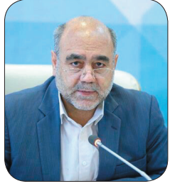
رئیس کل دادگستری چهارمحال و بختیاری: ایجاد بسترهای حقوقی و قانونی برای تعقیق شمار سال