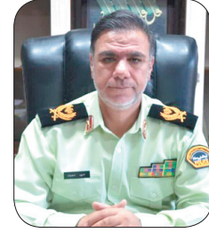
فرمانده انتظامی چهارمحال و بختیاری: کشف البسه خارجی قاچاق در شهرستان خانمیرزا