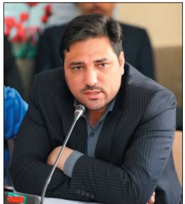
رئیس سازمان جهاد کشاورزی چهارمحال و بختیاری گفت: طی ۱۰ سال گذشته، کشاورزی استان

رئیس سازمان جهاد کشاورزی چهارمحال و بختیاری با اشاره به نقش دولت مرکزی در ایجاد اشتغال و توسعه اقتصادی مناطق، ادامه داد: متأسفانه در برنامه‌ریزی‌های مناسب، مدیران محلی با اعتبارات استانی محدود، اقدام به ایجاد ظرفیت اشتغال برای بیش از ۵۰ هزار نفر از طریق توسعه باغات بادام کرده‌اند.