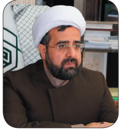
مدیرکل اوقاف و امور خیریه چهارمحال و بختیاری: تولید انرژی خورشیدی در اماکن وقفی، سرمایه‌گذاری برای رفع ناآرامی