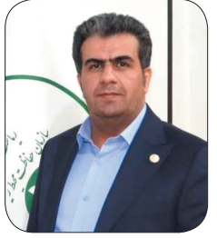
مدیرکل حفاظت محیط زیست چهارمحال و بختیاری: بسوی نامطبوع در شهر کرد؛ معضلی که کنترل شد