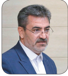
رئیس سازمان مدیریت و برنامه‌ریزی استان، ۵۴۸ طرح نیمه‌تمام در چهارمحال و بختیاری وجود دارد